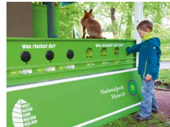
Tast- und Geruchssinn können getestet werden

Im Rahmen der Mittelbereitstellung für die BUGA Erfurt 2021 konnte die Idee des Urwaldmobils verwirklicht werden. 6 Monate täglich präsent auf dem Gelände der Stadt, zog Tausende von Besuchern an. Zu den Details: Zunächst erstellte der