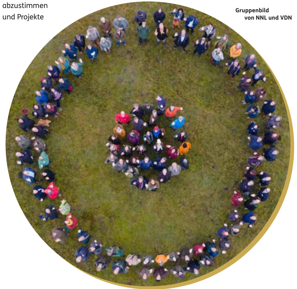
Gruppenbild von NNL und VDN