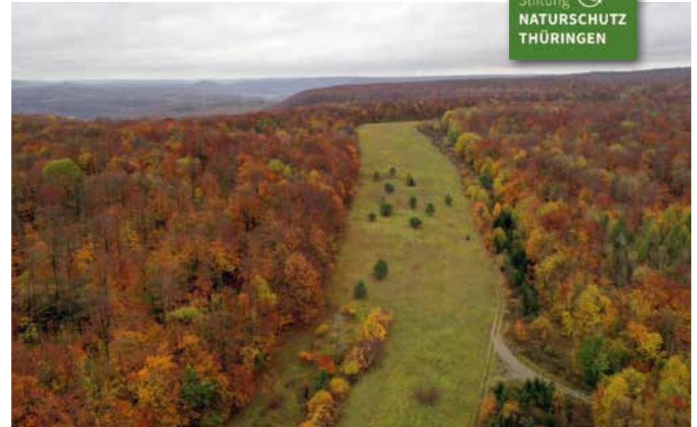
Grünes Band nahe Drei Herrenstein

„Grenzen trennen – Natur verbindet“ Mit meinen nun schon 57 Jahren, Jahrgang 1964, im Übrigen dem geburtenreichstem Jahrgang der DDR, aber auch der BRD bis zur Wiedervereinigung, musste ich am eigenen Leib erfahren, was der Satz „Grenzen trennen - Natur verbindet“ bedeutet. Aufgewachsen in einem Dorf in der Nähe des Sperrgebietes sowie mit einer fast 30-jährigen Tätigkeit als Forstwirt, zum Teil eingesetzt im Grenzgebiet mit Blick auf die Innerdeutsche Grenze in Form eines Metallgitterzaunes, fühle ich, was sich hinter diesem Satz verbirgt.