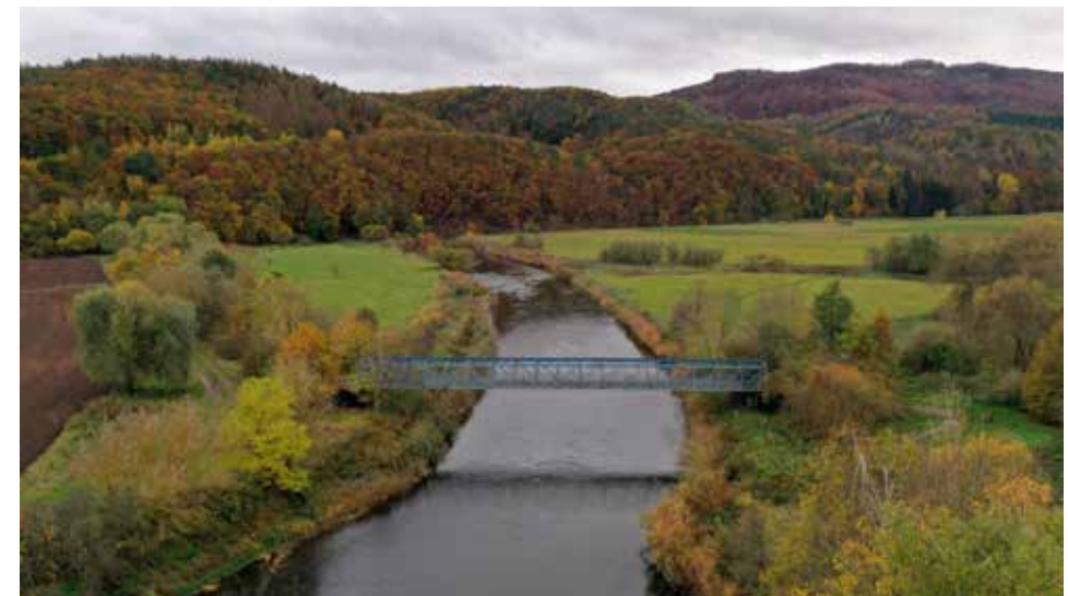
Ehemaliges Flussperrwerk der Werra (Grenzverlauf zu DDR-Zeiten in der Flussmitte)

wicklungs- und Informationsplan (PEIPL), festgehalten. 2019 entstand innerhalb der Stiftung Naturschutz Thüringen das Team Nationales Naturmonument „Grünes Band Thüringen“, bestehend aus drei MitarbeiterInnen in der Geschäftsstelle in Erfurt und acht GebietsbetreuerInnen an verschiedenen Standorten direkt am Grünen Band. Von dort agieren wir im jeweils ca. 100 km langen Abschnitt als Verbindungsperson zwischen der Dienststelle in Erfurt, der einheimischen Bevölkerung, den Verwaltungen der Region, den>NNLs, vielen Schulen, Touristikverbänden sowie weiteren Akteuren. Meinen Dienstsitz habe ich im ältesten Grenzmuseum Deutschlands, dem Grenz-