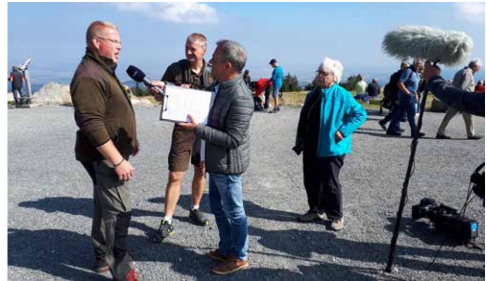
Das Medieninteresse am Seminar war groß

Am zweiten Tag stand der Vormittag ganz im Zeichen der defensiven Selbstverteidigung. Alle Teilnehmer*innen erschienen pünktlich in Sportkleidung in der