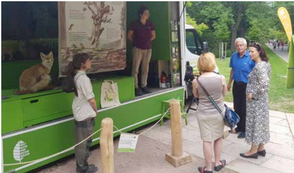
Am Urwaldmobil kommt man mit den RangerInnen ins Gespräch